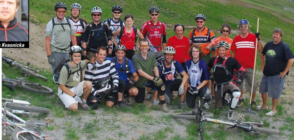
De finishing touch van de eerste IMBA flow country trail werd door de deelnemers aan de Europese conferentie van de IMBA in Livigno aangebracht.